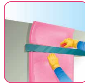
Corte el material excedente con una navaja o cuchillo con filo.