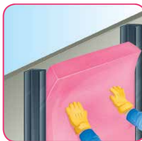
Presione hacia la cavidad.

En algunos pisos, como en los de duela o de madera, suele instalarse sobre el firme de concreto una estructura de madera con Aishogor de 7.6 cm (3") de espesor. Esto proporciona gran confort térmico y acústico en las habitaciones. Apropia para la capa doble.